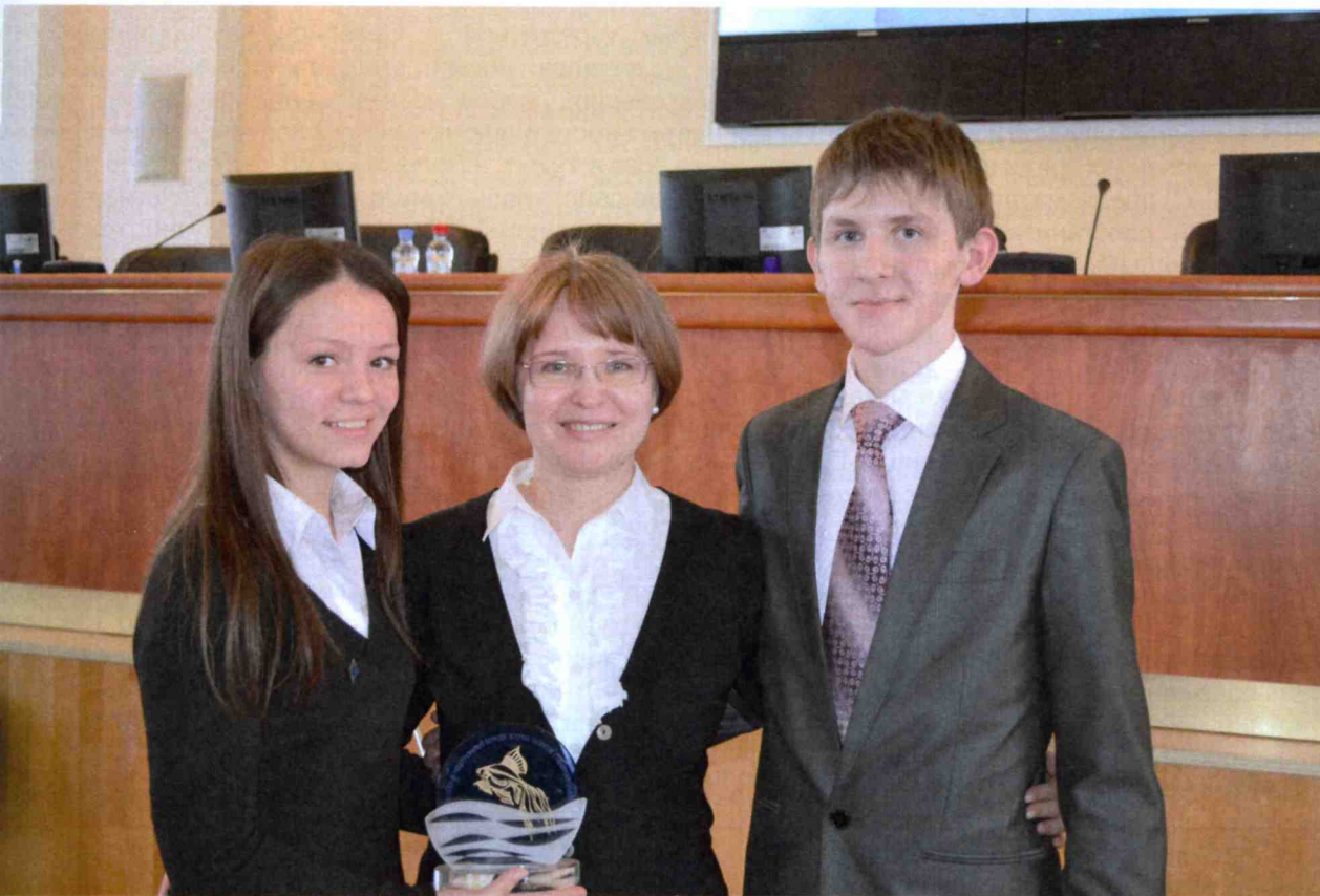
На фото – победители конкурса

Все финалисты получили дипломы Института консалтинга экологических проектов и подарки партнеров конкурса.