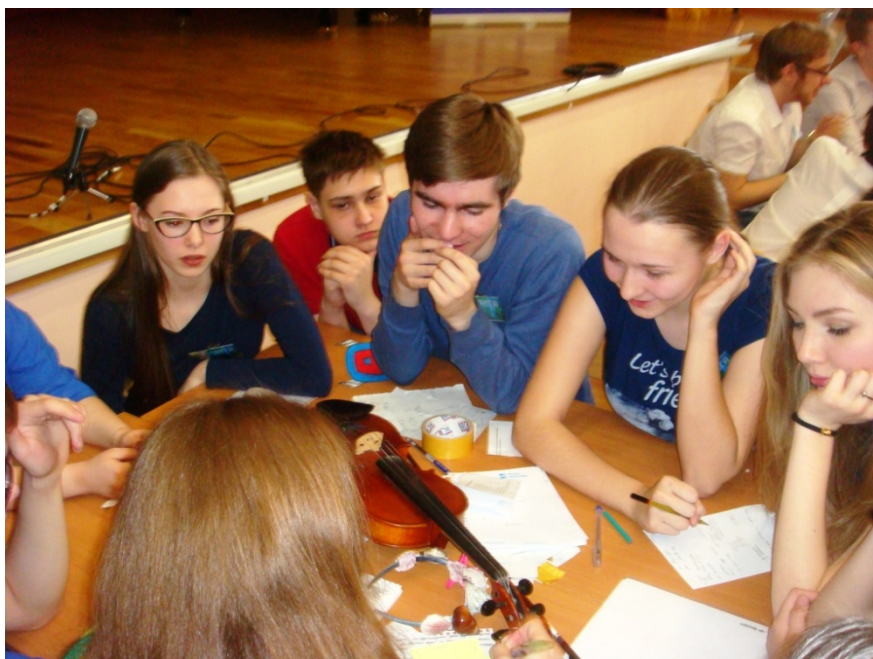
Фото 4. командная игра «Моя вода»