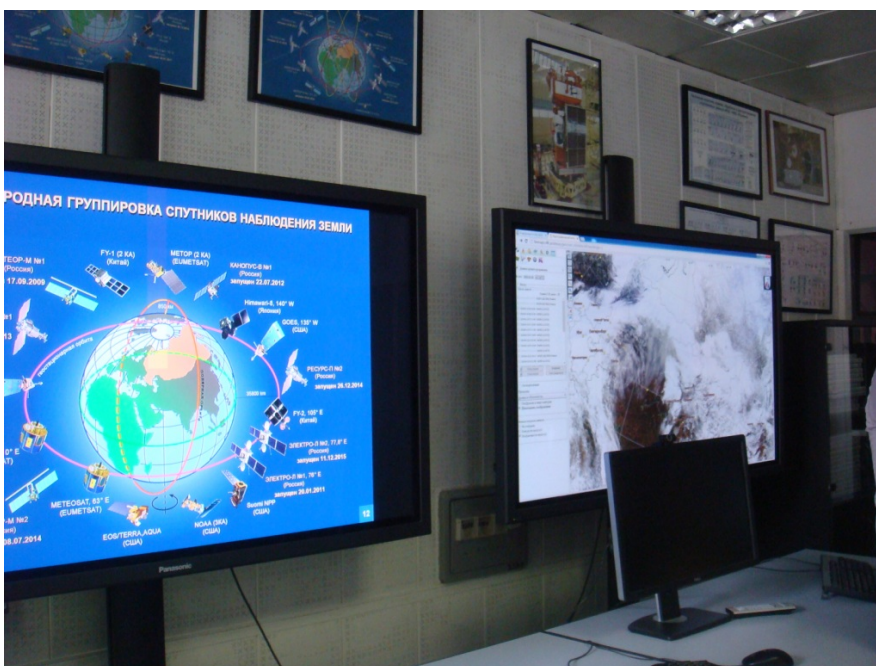
Фото 3. На экскурсии в НИЦ КГМ «Планета»