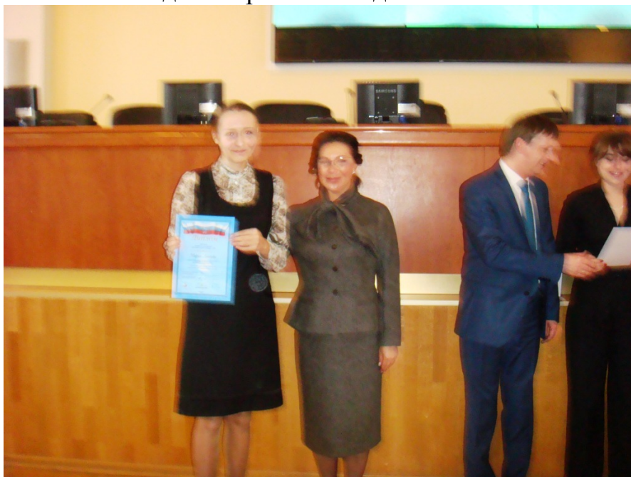
Фото 5. Вручение Диплома финалиста