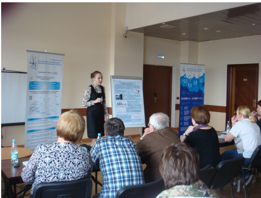
Фото 2. Защита проектов