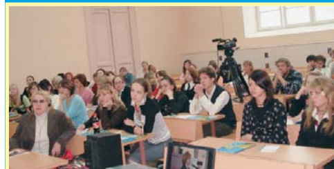
Пресс-конференция на факультете журналистики МГУ им. Ломоносова

55 субъектов Федерации, все административные округа: Адыгея Республика, Алтайский край, Архангельская область, Астраханская область, Башкортостан Республика, Белгородская область, Бурятия Республика, Вологодская область, Воронежская область, Ивановская область, Иркутская область, Калининградская область, Калужская область, Камчатский край, Карачаево-Черкесская Республика, Карелия Республика, Кемеровская область, Кировская область, Краснодарский край, Курганская область, Ленинградская область, Липецкая область, Марий Эл Республика, Мордовия Республика, Московская область, Мурманская область, Нижегородская область, Омская область, Оренбургская область, Орловская область, Пермский край, Приморский край, Ростовская область, Рязань