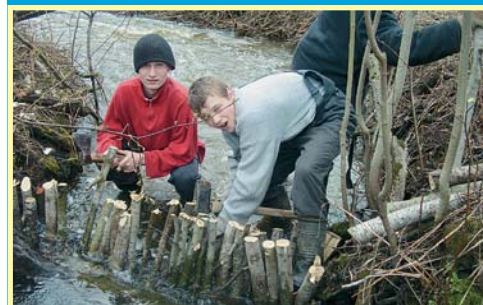
Новый школьный предмет «Строительство плотин»