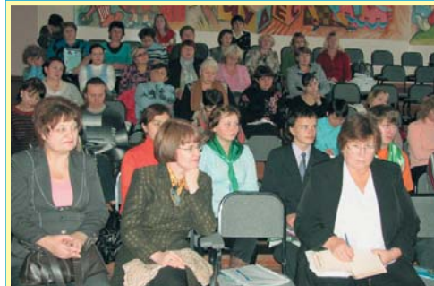
Семинар в Омске