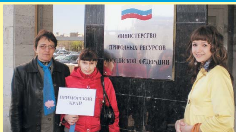
Делегация Приморского края после церемонии

ская область, Самарская область, г. Санкт-Петербург, Саратовская область, Саха Республика (Якутия), Свердловская область, Ставропольский край, Тамбовская область, Татарстан Республика, Тверская область, Томская область, Тульская область, Тыва Республика, Тюменская область, Хабаровский край, Ханты-Мансийский АО, Челябинская область, Чувашская Республика, Ямало-Ненецкий АО, Ярославская область.