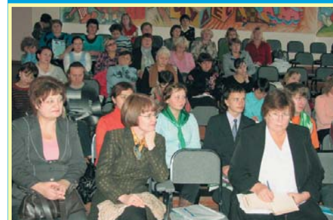
Семинар в Омске